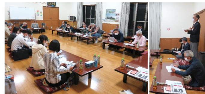
4月21日 役員会の様子(於 志公民館)