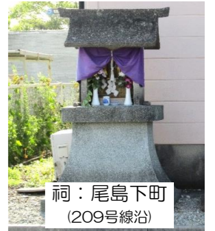
祠：尾島下町 (209号線沿)