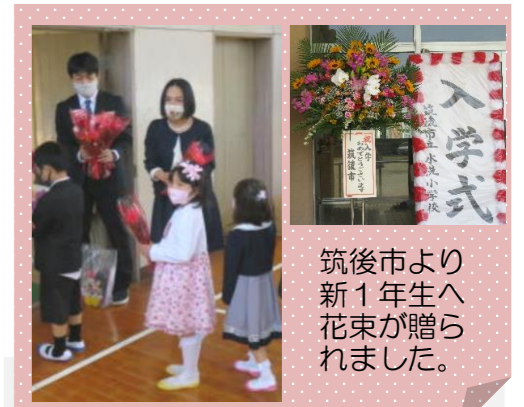
筑後市より新1年生へ花束が贈られました。

地域の皆さん、すでに新1年生も元気に通学していますので、見守りや声かけをお願いします。