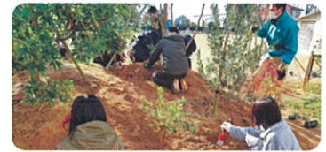
学校緑化(久留米市) 校庭の緑化