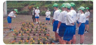
緑の少年団(豊前市) 花いっぱい運動

緑の募金は「緑の募金による森林整備等の推進に関する法律」 に基づき(公財)福岡県水源の森基金が福岡県知事の 指定を受けて行っています。