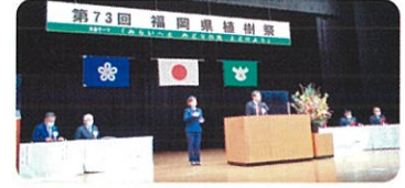
イベント(糟屋郡篠栗町) 第73回福岡県植樹祭