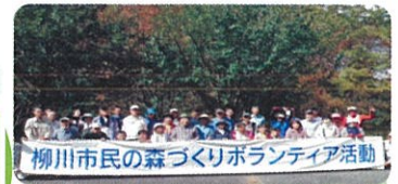
森林整備(八女市) 柳川市民の森での下草刈り