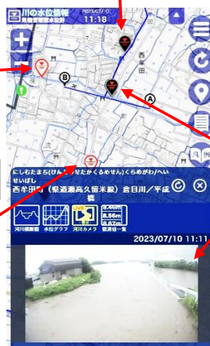
7月10日大雨時のライブカメラ(11時11分)