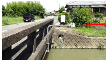
久保 新久保橋/倉目川支流