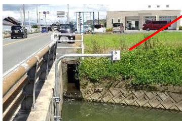
流①流中橋/久富川支流