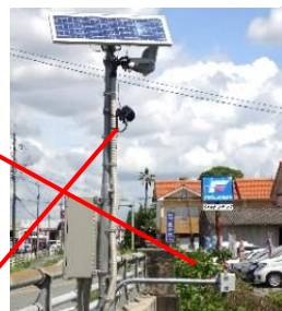
町 平成橋/倉目川 * カメラ付き