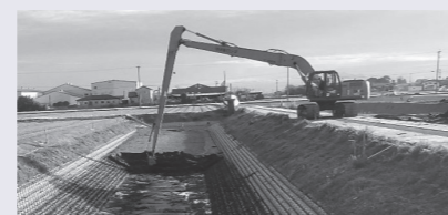
▲緊急浚渫推進事業