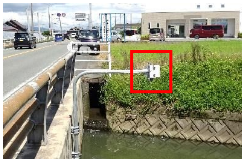
流① 流中橋/久富川支流