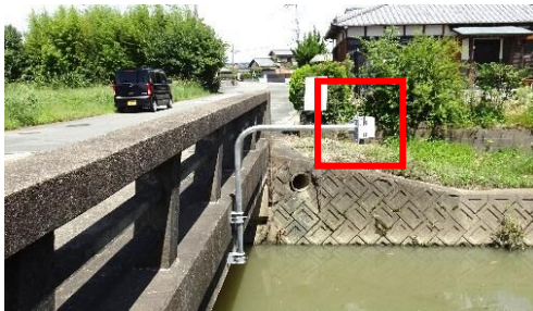
久保 新久保橋/倉目川支流