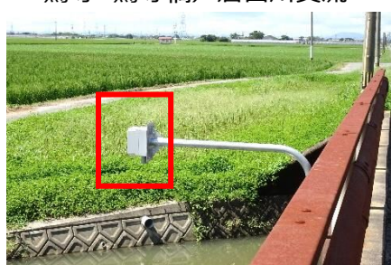
流② 妙建寺橋/大溝線支流