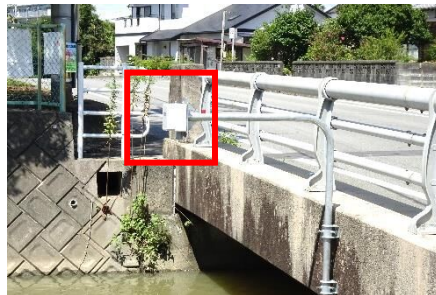
鷺寺 鷺寺橋/倉目川支流