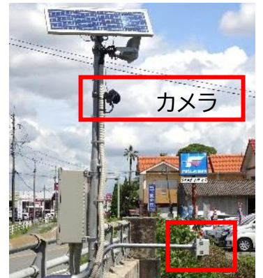
町 平成橋/倉目川*カメラ付き