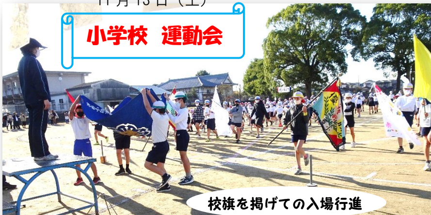
校旗を掲げての入場行進

◎天候にも恵まれ素晴らしい運動会でした。練習期間が少なかったにも関わらず、児童たちのきびきびした行動に感心させられました。