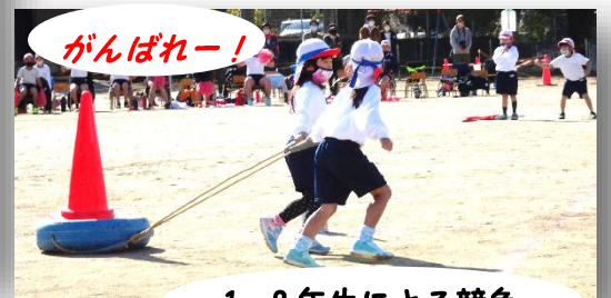
1・2年生による競争

◎天候にも恵まれ素晴らしい運動会でした。練習期間が少なかったにも関わらず、児童たちのきびきびした行動に感心させられました。