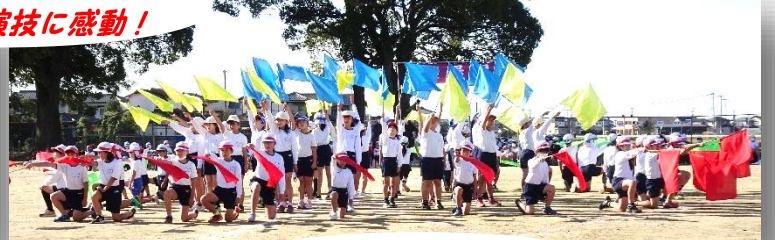
3・4年生による演技