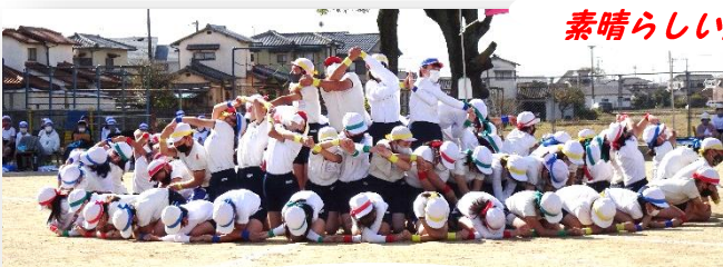
5・6年生による演技