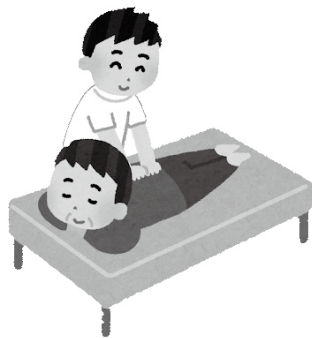
マッサージに対しても補助があれば・・・

※ 上司だけでなく、部下や同僚など複数の関係者で人事評価を行う手法。360度評価ともよばれる。