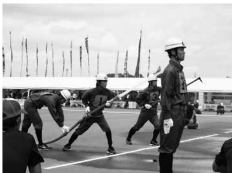
消防団員確保で、地域防災力の向上を

市長 消防団員確保の有効な手段であると認識する。体制維持の強化となるよう調査検討する。