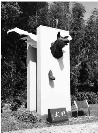
市民の森公園に佇む羽犬のモニュメント

「農業の自立を考える会」発行のチラシに記載されている。公有地拡大の推進に関する法律の規定により、(株)日清製粉などから市へ提出された跡地の売買情報と一致する