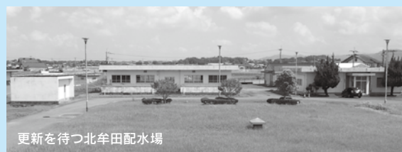
更新を待つ北牟田配水場

安全な水道水の安定供給、秩序ある市域の整備、道路・水路の整備と保全 13億6934万円