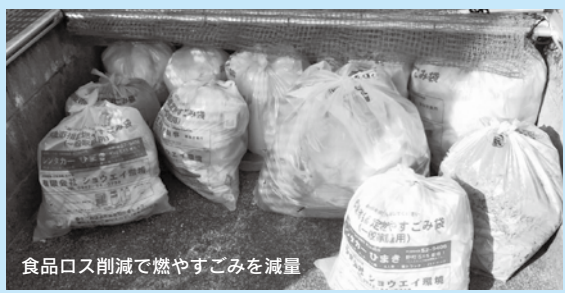
食品ロス削減で燃やすごみを減量