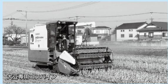
大豆専用コンバイン