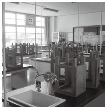
羽犬塚中学校の理科室。ここに空調設備が整備され、避難所機能も備える

答 市独自の制度であり、市で決定した基準。コロナ禍による収入減少を、市と折半するという考え