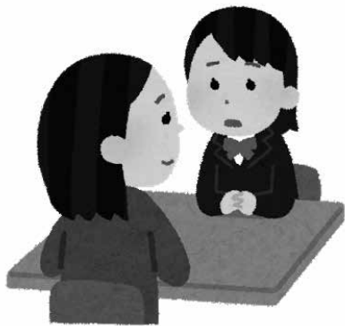
子どものSOSを見逃すな

SOSを見逃さない対策として、毎月のいじめアンケートや学期ごとの生活アンケート、担任による面談の実施、校内相談ポストの設置など、各学校が様々に取り組んでいる。