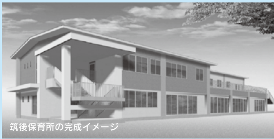
筑後保育所の完成イメージ