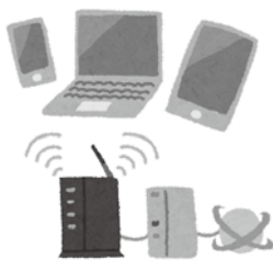
教育もネット時代に

答 児童生徒のリモート授業対応のため、インターネット環境のない家庭に整備の補助をするもの。当初1万円×200世帯を見込んでいたが、調査したところ、同環境が全くないのが16世帯であった。しかし、補助金申請は1件のみ。結果的に同環境が整わない者は、登校での授業となる。