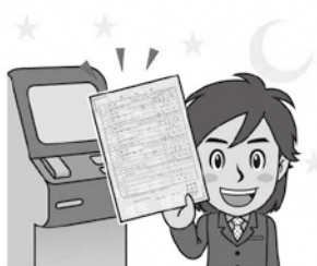
夜でもOK、コンビニ交付

民票と印鑑登録証明書をコンビニで交付できるようになる。戸籍証明や税証明については、個人番号制度の導入で、情報のネットワーク化が進み、証明書の必要性が薄れると思われるので、コンビニ交付は見送っている。