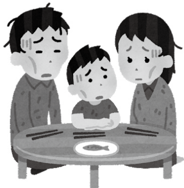
生活に困ったら、遠慮なく相談を

福祉課長 2月の厚労省通知で実施要領が改正され、照会は「扶養義務の履行が期待できると判断される者」に対して行うよう注意喚起されている。