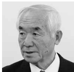
弥吉 治一郎 議員