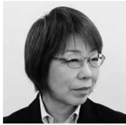
北原 辰江 議員

問 コロナ禍でのごみ排出の現状は。 市長 家庭から出る燃やすごみは、ほぼ横ばいだが、粗大ごみが約20%増となっている。テイクアウト等が増え、廃プラスチックも増加している。