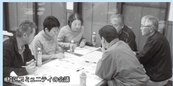
校区コミュニティの会議