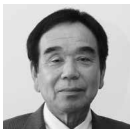
辻 義満 議員