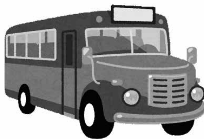
3年度も筑后市周遊観光バスツアー助成事業の継続を

本市でも行えないか。 商工観光課長 うきは市では、市内の宿泊施設利用者（宿泊・日帰り）に2500円〜5千円の助成を行っていると思う。本市でも、より効果的な観光事業者への支援方法や時期等を検討したい。