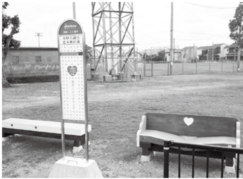
羽犬塚線は、コミセンの水田天満宮恋木神社前バス停まで延伸している。ベンチが可愛い♡♡♡

コロナ感染症拡大の影響によりバス利用者が大幅に減少し、例年以上に収益が悪化したため、路線の運行維持を図る地域バス路線維持費補助金の増額を行うもの。