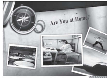
「Let's Dance! Let's Sing!!」

コロナウイルス感染防止のため、アウトリーチで小学校や保育園・幼稚園に出かけて行ったり、ステージを観てもらうことができなかったあいだ、筑後にいる子どもたちに届けたくて、サザンクス筑後では「あーとギフト」を作り5月3日よりYouTubeチャンネルで配信しています。