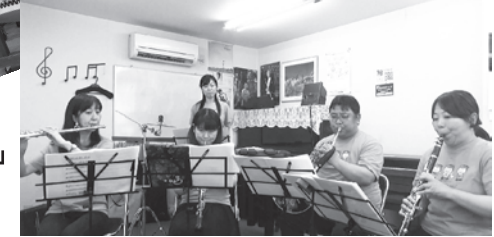
「ドレミの歌」「小さな世界」