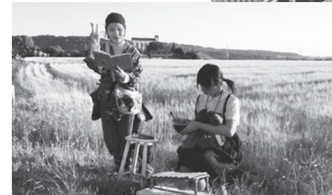
「ドングリ山のやまばあさん」