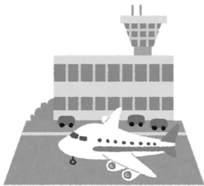
筑後市に集積した農産物を世界へ

問 企業誘致は市長選挙の公約だ。九州で生産された農産物を筑後市に集積し、輸出するという大きな構想がある。 九州佐賀国際空港までは40分。筑後市に集積さ