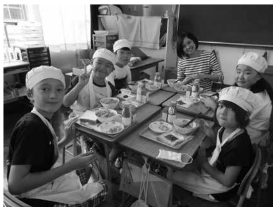
楽しい給食風景(下妻小学校)

員個々の能力、市の組織力を高めていく必要がある、人事評価制度も必要に応じてバージョンアップしていかなければならないと考えている。 問 上司も評価されることで、自分自身のスキルアップや管理能力向上にもつながると思うのでは、非とも取り組むべきだ。 試行でもいいから、まず導入してみてもどうか。 市長公室長 今年度に導入への課題等を研究し、令和2年度中に導入の是非を判断する。