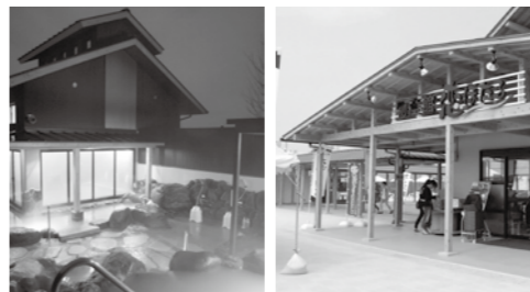
「恋ぼたる」の露天風呂(左)と物産館(右)