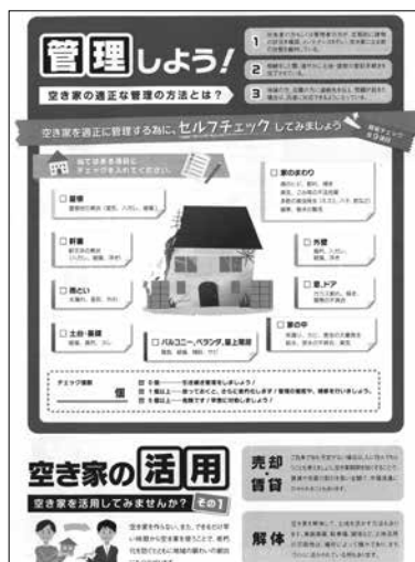
空き家適正管理啓発の冊子から