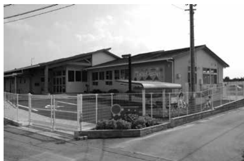
おひさまハウス(サザンクス筑後北側)

問 母子への支援、児童虐待予防のための子育て世代包括支援センター設置は。 市長 平成29年4月から「おひさまハウス」での実施を検討してきたが、母子保健の重要性を考え、