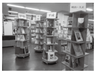
昨年度の県事業で導入した県産材の回転式書架(図書館)

問 恋ぼたるの物産館と温泉館の指定管理料で、債務負担行為の補正が1億1000万円(令和2年度から5年間)。単年度の管理料は約2200万円となる。今年度の当初予算より年間約500万円も高くなるのは。