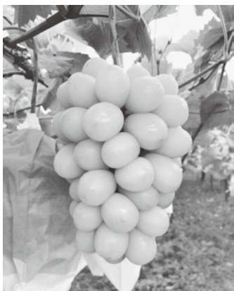
人気の返礼品、シャインマスカット

問 返礼品を地場産に制限し、過度な返礼品競争に歯止めをかけるため、ふるさと納税の新制度が6月1日、スタートした。市は、どう取り組むのか。 市長 平成30年度の寄付額は、約1億8千万円で、