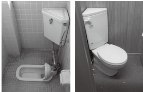
洋式化前と、洋式化後の小学校トイレ