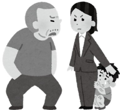
何としても、子どもを虐待から守る!!

問 全国で子どもの命が脅かされる事故、事件が続いている。そんな危険な現状についての認識は。 市長 事故について、設備による安全対策には限界がある。関係機関と連携を強め、安全運転の啓