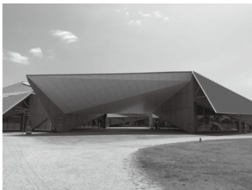
東京オリンピックの聖火リレーの中継地点に選ばれた九州芸文館