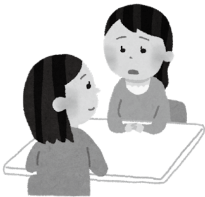
女性の悩みやDVの相談は、年々増えている

問 待機児童対策、保育士等確保事業とは。 子育て支援課長 保育士 育休復帰支援事業や保育施設PR等、現役、潜在、新卒保育士を対象に、10の支援事業（パッケージ）を準備し、周知している。