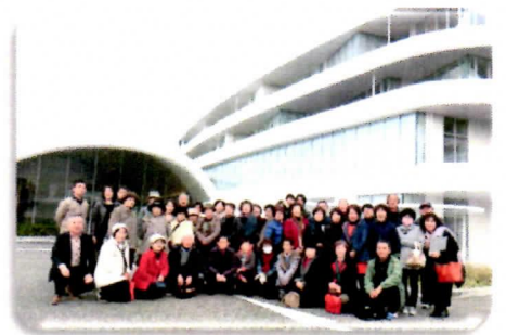
《TOTOミュージアム前にて》

なお今回は右上の集合写真を1家族1枚配布いたしますので、ご都合の良い時にコミュニティ協議会事務室までお越しください。