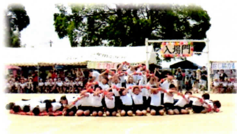
《「仲間を信じ協力して」》