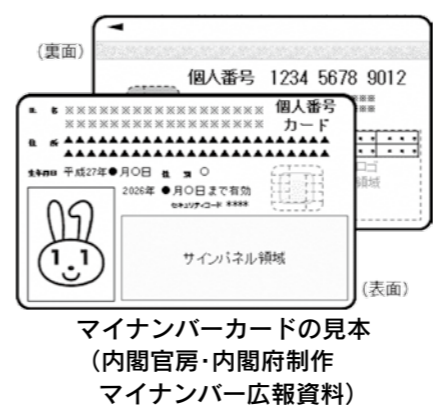
マイナンバーカードの見本 (内閣官房・内閣府制作 マイナンバー広報資料)

補正予算の社会保障・税番号制度関係事務については、マイナンバーカードの発行件数が少ないため、今年度の予算を次年度へ繰越すもの。 問 現在の発行件数は。 答 29年2月末で申請件数は3289件、交付件数は2513件。申請から交付までに時間を要することやカードができて取りに来ない人がいるため、申請と交付件数に差がある。またカードを持っていることでのメリットが少ないことも、申請件数が伸びていない要因だと考えている。