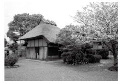
山柵窩に案内所を設置（水田地区）

問 山柵窩の関連事業について、金額の内訳は。 答 山柵窩の修復費は123万円、北側に建設