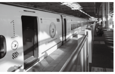
新幹線筑後船小屋駅では、3月からホームが無人化となった

自然災害により発生する鉄道施設・設備の被害からの復旧に向けた支援の拡充を図ることや脱線防止ガード設置の延長など、鉄道防災・予防保全の支援の拡充を図ること、また駅構内での利用者の安全を図るため、「駅無人化（ホームを含む）」を回避するための支援を図ることなどを、国に対して要望した。