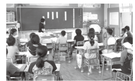
筑後市独自で35人学級の取り組み

筑後市教育職員の給与等に関する条例の一部を改正する条例は、小学校の35人以下学級編成のため任用している教職員の給与を改定するもの。教職員の給与は、福岡県の教育職員給与表を基準に算定している。