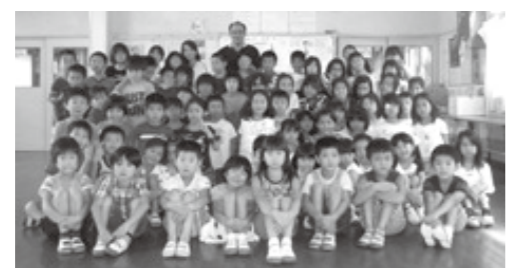
統一基準となった学童保育所

答 国の考え方は、これまでと変わらない。今回の改定は、県による助成対象年齢の引き上げも勘案して拡充したもの。