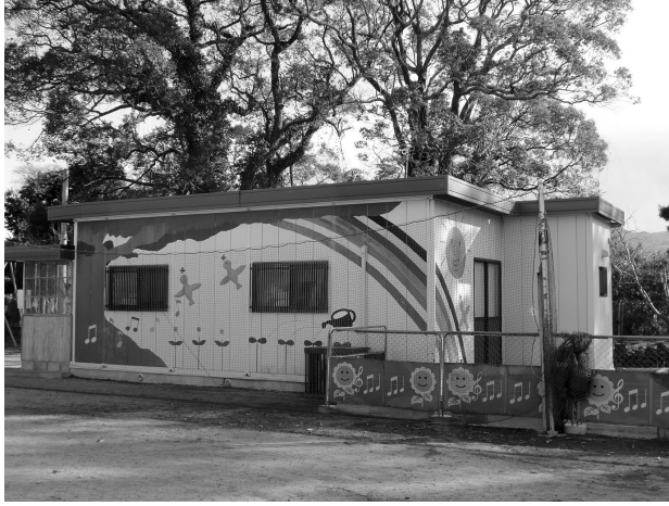
手狭になり増築工事が始まった 古川学童保育所「くすの木ハウス」