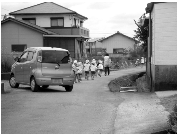
対応が急がれる道路改善要望

市長 来年度は生活道路の整備を重点事項として予算編成をし、担当職員も増員して対応したい。