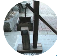
いど 井戸のポンプ