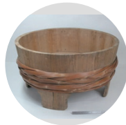
せんたくだらい 洗濯盆