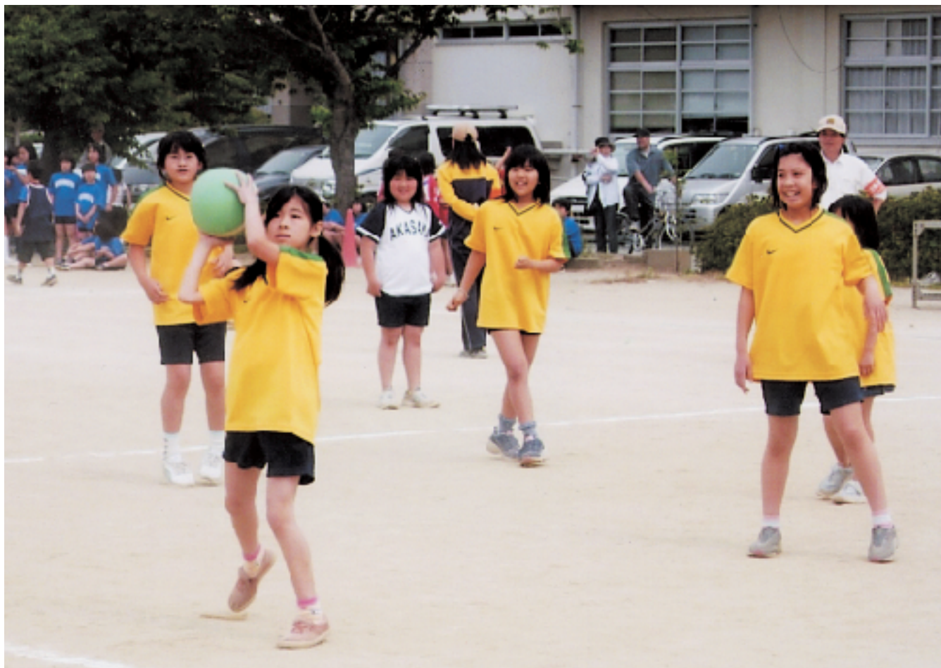
子どもドッジボール大会の様子