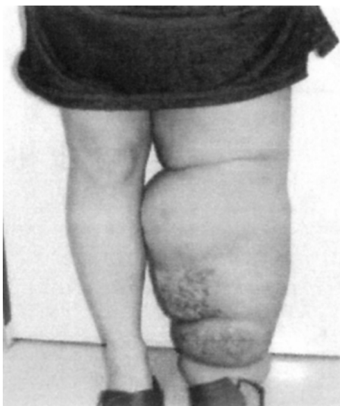
リンパ浮腫の症状

【リンパ浮腫とは】乳がん・子宮がん・前立腺がん等の外科的療法や放射線療法の後遺症として発症し、リンパの流れが滞り、組織間隙にタンパク質や水分が過剰に滞留した状態をいいます。 【弾力ストッキングとは】脚を二様に圧迫するのではなく足首から太ももと上に行くほど段階的に圧迫度が弱くなるように作られている医療用ストッキング。