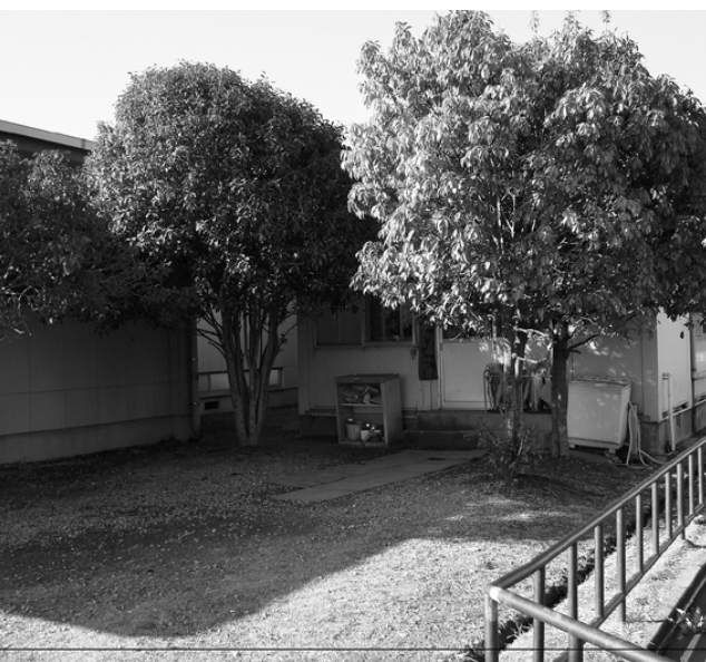
学童保育所(水田小校区)

問 地域づくり委員会の地元説明会での資料では、一律20%の補助金カットが掲げられているが市民サービスの切り下げにつながる。むしろ増額すべきだ。