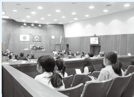
熱心に議会を傍聴する古川小学校の6年生たち

一方、筑後市議会では、子どもの時から議会に関心を持ってもらおうと、子ども向けの小冊子「キッズ★筑後市議会ガイド」を作り、ホームページに掲載したり、小学校に対し、市議会の見学や傍聴の案内をしたりしています。また、これまで「児童及び乳幼児は、傍聴席に入ることができない」となっていた傍聴規則を、令和2年6月から、児童（小学生）でも傍聴できるようにするように改正しました。