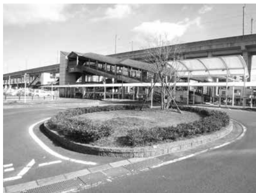
羽犬塚駅西側のロータリー。こちら側に改札口があれば・・・

問 人口が増加している今が、自治体として税金を投じてでも、西改札口整備を推し進めるタイミングではないのか。