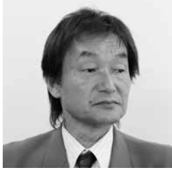
高野 一成 議員

問 新型コロナウイルスの第3波により日々感染者が増えている。特に、高齢者の感染者数が増加傾向にある。本市にも多くの高齢者世帯があるが、その家族が市立病院で、PCR検査を受けること