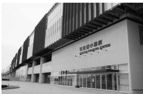
ここが分岐駅になれば、市は変わる

莫大な財政負担をして、在来線の利便性を低下させてまで新幹線を整備するメリットはないとの見解だ。注視ではなく、筑後船小屋駅分岐の実現を目指し、活動を開始するとの気概が必要では。 市長 筑後船小屋駅からの分岐について、関係する市や町、筑後七国活性化協議会の中で、一緒に要望できないか相談する。