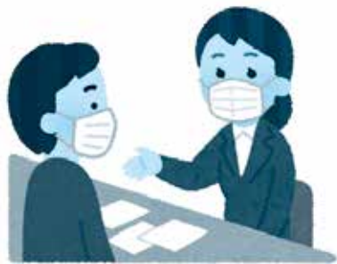
きめ細かな対応で、安心できる生活を（福祉課☎65-7019）

問 当市における生活困窮者への支援状況は。 市長 生活困窮者自立支援法に沿って、専門相談員を配置し、生活保護担当職員と連携して相談、支援を行っている。その結果、早期自立が図られ、生活保護受給率は、低い状況になっている。 問 新型コロナウイルス感染拡大の影響は。 福祉課長 生活困窮者に関する相談件数は、昨年より79件増え、総合支援