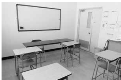
筑後北中学校に新たな生徒の「居場所」が