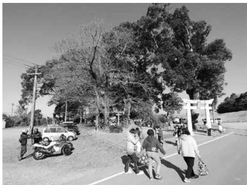
溝口竈門神社には、遠方からの来訪者も

問 小規模な水路には、法面の崩壊や土砂の堆積により水路の排水、保水機能が低下している所があるが、対策が必要では。 水路課長 危険性や緊急性を考慮しながら、農村環境整備事業や集落基盤整備事業など、国・県の補助事業を有効に活用し、計画的に対応したい。