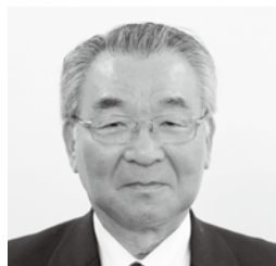
貝田 義博 議員

市長 国は、9月に新型コロナウイルス感染症の検査体制の拡充に向けた指針を発表。必要な人が、迅速に検査を受けられるとともに、感染防止に向けて、広く検査が受けられるようにすることが重