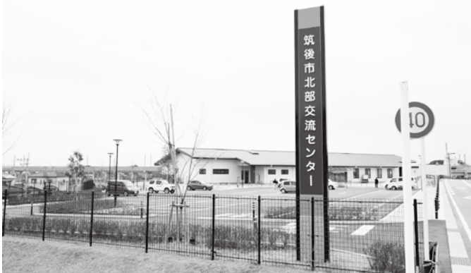
指定管理に移行する筑後市北部交流センター(チクロス)

している清掃管理費が、地域の人の雇用により安くなった。また、昼間の運営を同協議会に委託しているが、来年度以降も管理人等、現場のスタッフは、今までのとおり地域の人が雇用される。市で行うよりも、さらに地域に密着した、利用者にとって良い施設運営ができるものと考えている。