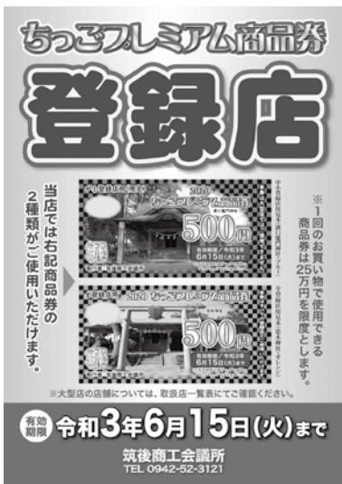
今回のプレミアム商品券は6月15日まで有効

商工団体指導に要する経費は、新型コロナウイルス感染症拡大の影響を受けている市内事業所の支援として、プレミアム商品券を追加発行するもの。なお、前回の抽選漏れが約8700万円分であったことや、周辺自治体の状況も参考にし、1億2千万円分の発行とした。 問 前回発行時の抽選に漏れた人を対象にするのか。 答 前回漏れた人を優先