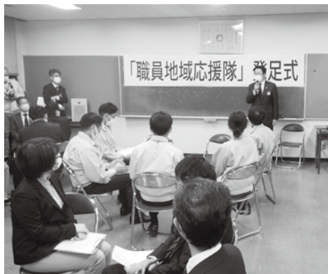
11月6日、職員地域応援隊が発足した。現在、隊員は70人