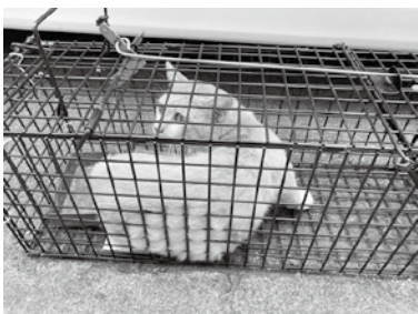
かわいそうな命を増やさないためにも、TNR（捕獲→不妊去勢→解放）活動の推進を！！