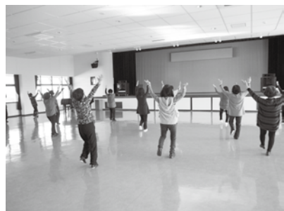
サンコア軽運動室で、リズムに合わせて体操を楽しむ皆さん。床を張り替え、卓球ができるようになる

答 健康維持を目的とした軽スポーツ。窓ヶ原体育館や各小中学校の体育館で行われている健康づくりのための卓球を想定。耐久性のある床材を張ることで、幅広く利用してもらいたい。