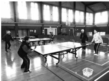
利用者が存続を願う窓ヶ原体育館 (イメージ)