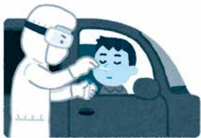
PCR検査体制の拡充が必要