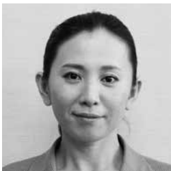
鶴 佑季子 議員