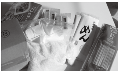
『フードパントリー（食品の無料配布）』で生活困窮者も支援へ