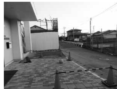
筑後保育所入口の狭い道路

問 筑後保育所と学童保育所が開設され、4月から定員が倍増する。園児や学童の送迎時の安全対策を、市はどのように考えているのか。