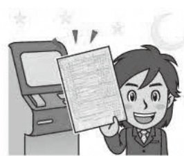
マイナンバーカードを使えば 住民票もコンビニでOK