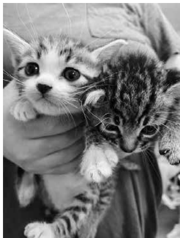
かわいそうな命を増やさない飼育を