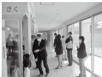
木のぬくもりが感じられる新園舎 (筑後保育所)

答 今年度になり医療費は、前々年度を上回る伸びを示している。現時点では、分析までは難しいと考えている。コロナ禍で、受診控えの反動ではないかとも考えられるが、それを確定するようなデータはない。