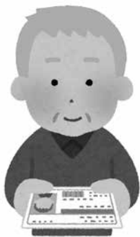
返納後の移動手段について支援を

市長 周辺市町が、自主返納時にタクシー利用券を交付していることを踏まえ、現在策定中の公共交通計画の中で、再検討する。