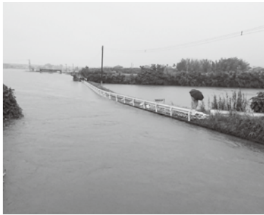
大雨で氾濫した倉目川(令和元年撮影)

答 今年度は市の発注工事に加え、例年になく県の発注工事が多く、人手不足に陥っている。少額工事であれば、主任技術者は複数の現場を受け持つことができるが、この工事は高額で、専任でな