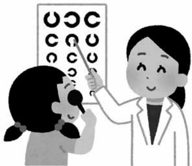
屈折機器導入で、弱視の見逃し防止へ