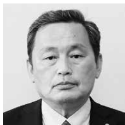
山下 秀則 議員