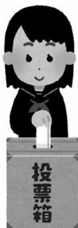
12年ぶりに選挙戦となった

子育て支援課長 保育指針に、子供の保育に関する伝達等を通じ、保護者との相互理解に努めるとある。連絡帳や園便りなど保育に関するものを、配付すると認識している。 問 事案は、子どもの良心を選挙に利用したとも取られかねない行為。改めて調査すべきでは。 市長 事実関係も含め、調査と対応を検討したい。