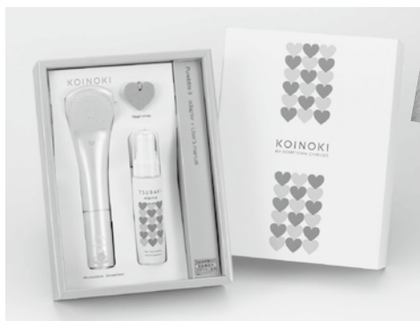
返礼品にシャワーヘッドやコーヒー豆も追加