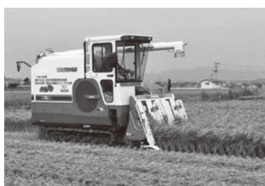
事業を活用してコンバインなどを購入（イメージ）