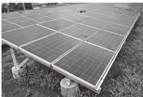
野立て式太陽光発電設備

市長 女性が安心かつ自立して暮らせる社会の実現を目指す。引き続き困難な問題を抱える女性への支援を行っていく。