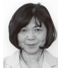
貝田 弘子 議員