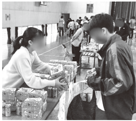
孤立・孤独を防ぐ多様な居場所作り 「出張!!!こども食堂ちっこ」の様子

ように、受援力は大切なもの、子ども達につけるべき力と考えている。 福祉課長 今年1月より実施している重層的支援体制整備事業において、予防の観点も含めた声を上げやすい相談窓口の環境整備に努める。受援力は、助けを求めたり受け入れたりと、支援を受ける側に必要で大切な力と理解している。声を上げる事で必要な支援を受け取りやすくなると考える。 問 法の施行を受け今後の取組は。 市民生活部長 法の視点も組み入れ推進を図る。