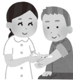
10月から始まった新型コロナワクチン接種

で協議中。低所得者は費用免除の措置も行う。 問 ワクチンには使用期限がある。期限内に見込みより接種者が少ない場合、廃棄分の負担は。