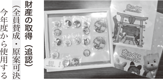
山柵窩の商品開発を（写真は「恋のくに」関連グッズ）

問 山柵窩の商品開発を 答 確かに山柵窩に関する商品は少ない。指定管理者と協議し、商品開発等の参考にしたい。