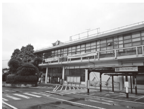
コンパクトな新庁舎を