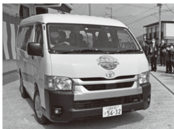
筑後北校区コミュニティ自動車(愛称「きたきた号」)

問 市の北部、南部の交通不便地域の解消を図ることができたのか。 答 筑後北校区での運行が始まったことで、令和5年度には公共交通力パー率が市内全域の92%となり、解消を図ることができた。