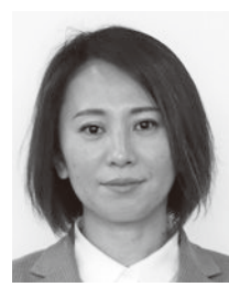
鶴 佑季子 議員