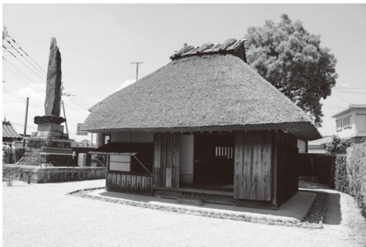
適正に管理し後世に残したい山梶窩

しい状況であるが、物販を伸ばすとともに、施設を後世に残すため、適正管理に努めていきたい。