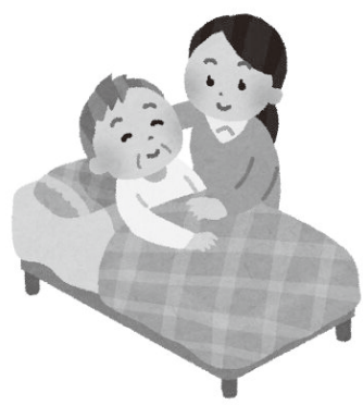
本人を尊重した尊厳あるケアを

共に支え合い、地域の中で自分らしく暮らし続けられるよう取組を進める。 ユマニチュードの普及推進は