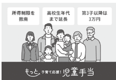
国は児童手当の拡充をするが…

玉の一つだ。国が児童手当の拡充等をするからといって、令和7年度で廃止すべきではないのでは。 答 10月から児童手当の拡充、出産子育て応援交付金の恒久化、多子世帯による大学の授業料免除（所得制限なし）など、多子世帯への経済的負担軽減がかなり進む。よって、多子出産祝い金は廃止し、その分を定住促進関係（マイホーム取得支援事業や新婚世帯家賃支援事業等）の補助金に充てることを考えている。来年度の予算編成の中で何が必要か検討していく。