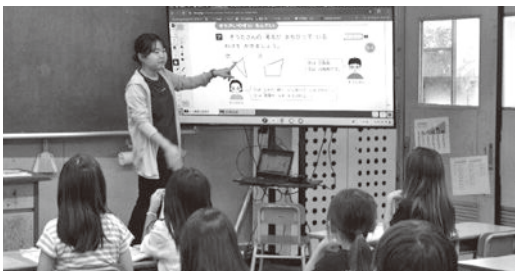
デジタル教科書と電子黒板を使用した授業

約した根拠は。 答 教科書の購入は、取次所が決まっている。よって一般競争入札ではなく随意契約となった。 問 同じような事例が過去にもあったのか。 答 なかった。ちなみに2年度はデジタル教科書ではなく紙の教科書だったので、金額的に該当していない。