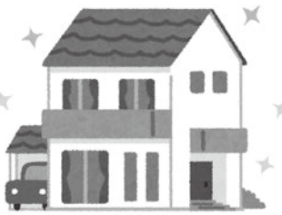
マイホーム取得も増えている

問 庁舎建設基金積立金は、当初予算で1億円、今回補正で6億円の計7億円。決算後の余剰分が多額に出たので積立てるのか。 答 過去にも決算で余剰があれば、積み増しをしている。庁舎建設関連は、国等の支援メニューがない状況。一定の基金積立が必要だと考えている。