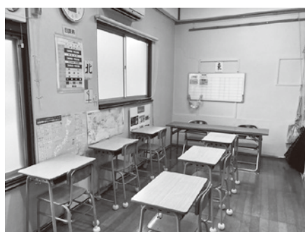
一人ひとりのペースに合わせて学べる教育支援教室「スマイル」