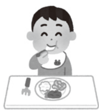
保育所等の給食費を引き続き支援

主な内容は、国が経済対策として行う令和6年度個人住民税の定額減税に関連する給付金等の関係経費7億7145万円を計上。その他、AIを活用した市ホームページの更新業務委託料1667万円、筑後北コミュニティ協議会の防災資機材の整備に対する補助金200万円や、物価高騰支援【第25弾】として、保育所等給食費支援事業（第3弾）1746万円、プレミアム商品券発行事業（第8弾）2500万円なども増額された。