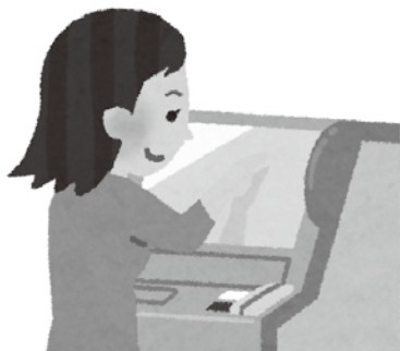
4月から300円になったコンビニ交付。デジタル化は国の取組なので、財源確保を