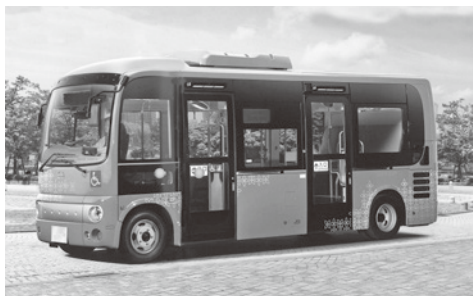
羽犬塚駅周辺中心循環バスのイメージ