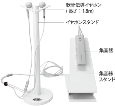
窓口用の軟骨伝導イヤホン

問 高齢等で難聴となった市民への配慮として、軟骨伝導イヤホンの窓口設置はできないか。 市民生活部長 難聴者な