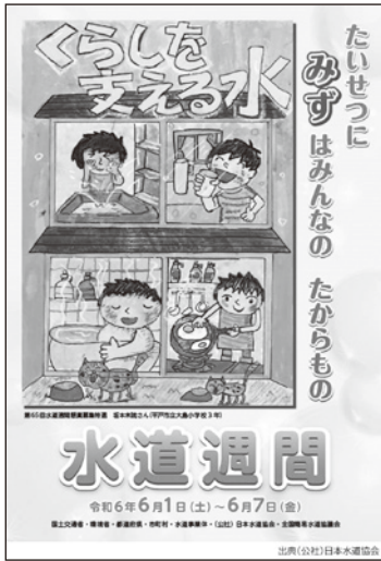
水道週間のポスター

（※）炭素とフッ素が結びついていて自然界では分解されず川などに堆積し長期間残存する。