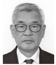
宇野 晶 議員

問 私たちを取り巻く社会情勢は大きく変化している。今回就任した副市長に求める役割は。 市長 副市長には市役所の各組織、各部門の調整役を担ってもらい、市民の皆さんから信頼される市役所、組織運営に尽力してもらいたい。 問 副市長の基本姿勢は。 副市長 施策の実現のためには、市民の行政への信頼が重要で、信頼される市役所の組織づくりが必要と考える。同時に、職員と一丸となって住民福祉の向上に邁進したい。