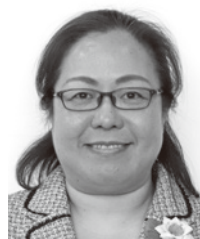
川口 樹里 議員