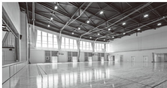
空調設備が設置された体育館（避難所としても使用）

答 筑後南小の体育館は、バレーボールコート2面分の広さ。壁に取り付けた空調機は8台で、冷暖の風が吹き出すスポット式を導入している。使用料は、近隣自治体を調査し設定した。