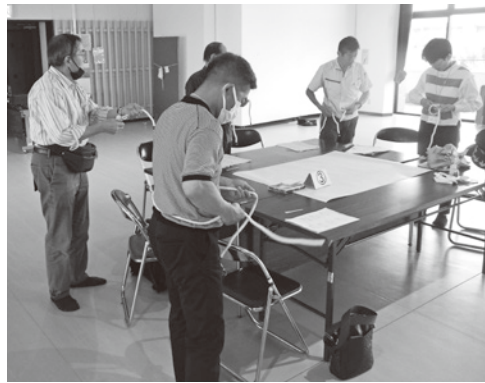
ちっご防災エキスパート養成講座

問 市内の防災士の数は。 市長 社会のさまざまな場で防災力を高める活動に取り組んでいる防災士は、市内に82人の登録がある。