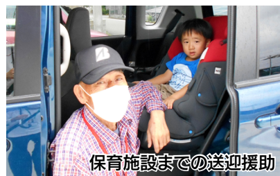
保育施設までの送迎援助