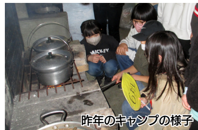
今年のキャンプの様子