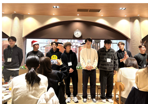
▲若鷹 Dinner で選手がおもてなし