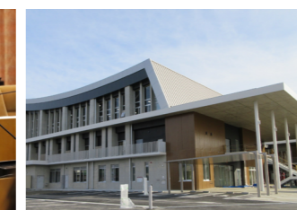
▲新しいセンターの外観