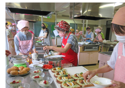
▲過去の料理教室の様子

【とき】12月10日(火) 9:30~12:30 【ところ】サンコア(料理実習室) 【対象】市内に住んでいる人 【内容】専門の講師による国産鶏肉に関する講話、調理実習 【参加費】500円 【定員】15人 【持ってくる物】エプロン、三角巾、ハンドタオル、筆記用具 【申込み・問合せ】12月6日(金)までに、市食生活改善推進会事務局(健康づくり課内 ☎53-4231)へ。