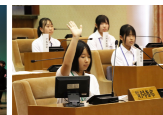
▲中学生こども議会