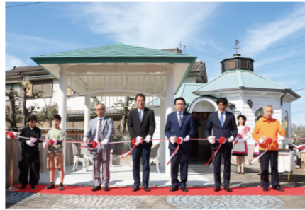
▲新しい鉱泉場のリニューアルを祝ったテープカット