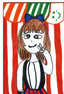
▲しふおんけーきさん