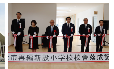
▲再編新設小学校校舎落成式典