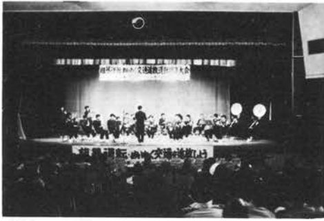
写真は4月6日市民会館で開かれた粗暴運転・めいわく交通開放推進大会

五月は、鮮やかな新緑に誘われて、マイカーを利用したドライブの機会が多くなる季節です。それだけに、一年のうちでも、この時期は交通事故が多発します。この号では、新緑の行楽期を安全に楽しく過ごすためのドライバーの心得をまとめてみました。