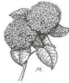
カットは泉グループ